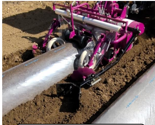
溝浚板ASSY3型 全長が短くコンパクトです。