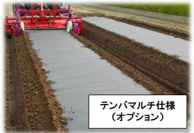
テンバマルチ仕様 (オプション)