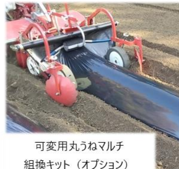
可変用丸うねマルチ 組換キット (オプション)